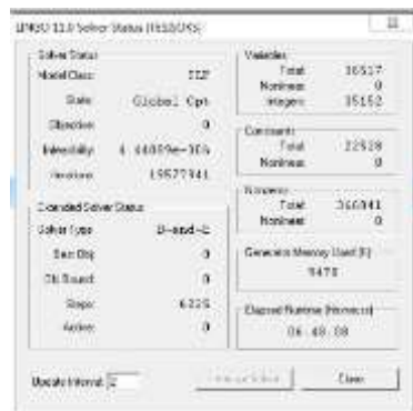
Gambar 5.1. Hasil running program Lingo Analisa hasil running model menghasilkan suatu jadwal penugasan kapal dengan bilangan zero-one (0-1). Penjadwalan kapal yang didapatkan adalah jadwal penugasan kapal X_{ijk} terlihat pada Tabel 4.1.

Running model didapatkan hasil pemecahan terlihat pada Gambar 5.1.